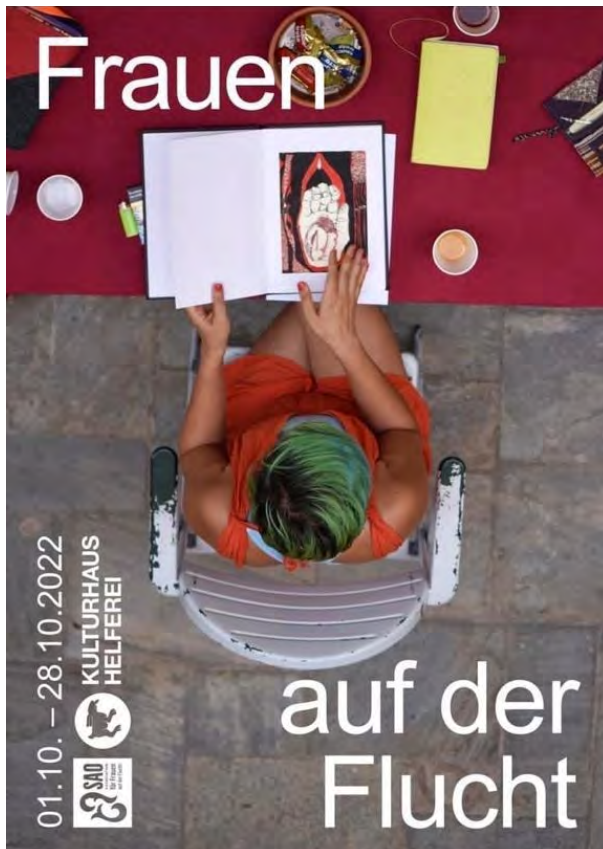
Plakat zur Ausstellung im Kulturhaus Helferei / Foto: Helena Schätzle