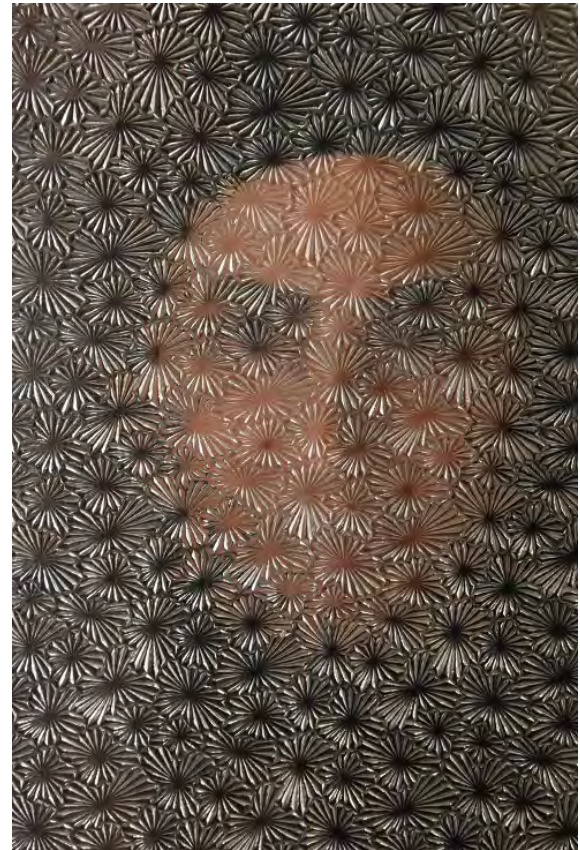
Klientin Bashira Centre, Lesbos

Die Zusammenarbeit mit dem Team der Helferei war von Neugierde und grosser Wertschätzung auf beiden Seiten geprägt.